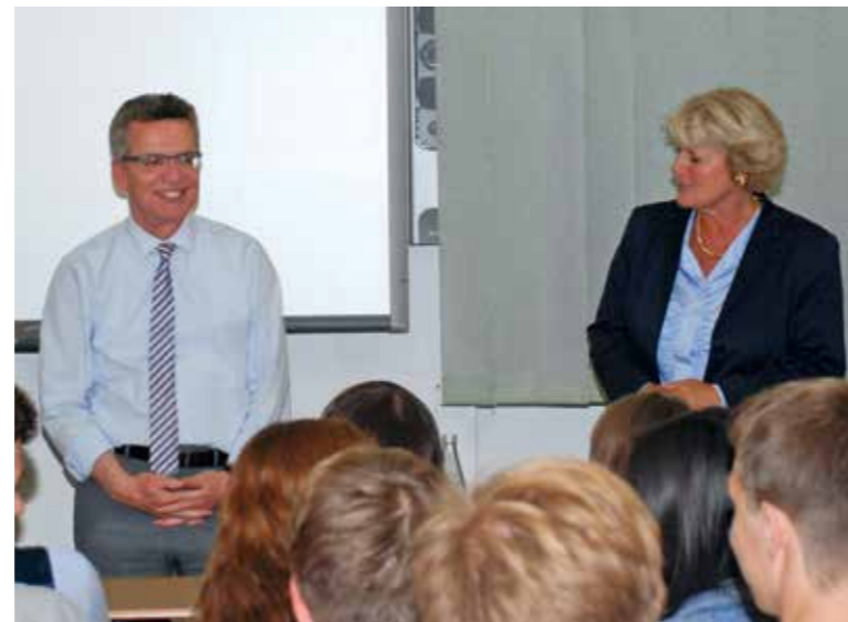
Monika Grütters mit Bundesinnenminister Thomas de Maizière bei einer Diskussion mit Berliner Schülern